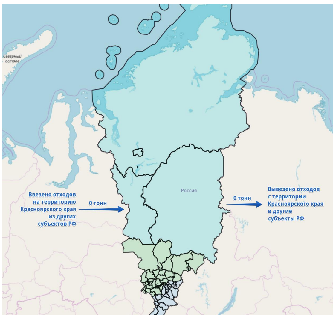
Рисунок 9.3 - Объемы отходов, ввозимых из других субъектов РФ, и вывозимых в другие субъекты РФ

Движение отходов, направляемых в другие субъекты Российской Федерации, от источников образования отходов либо от объектов, используемых для обработки отходов, не осуществляется.